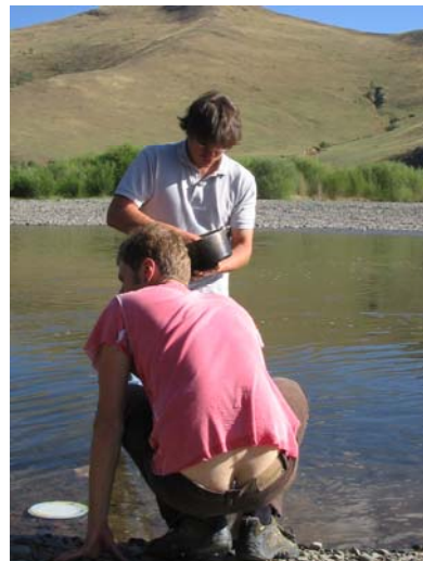
Men at work!