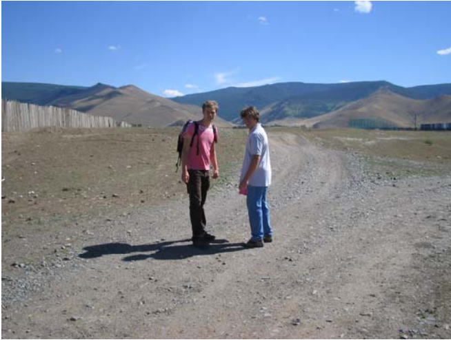
Nur 20 Minuten zu Fuß von unserem Block entfernt beginnt die Piste Richtung „Tool“, dem Fluß, der das Naherholungsgebiet Ulan Bators ist!