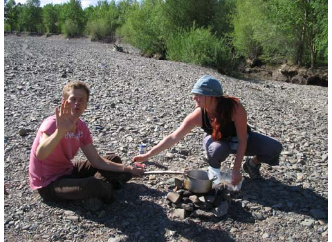
Ein kleines Lagerfeuer – ein Blechtopf drauf und mongolisches Fleischchen rein, mmmmh!