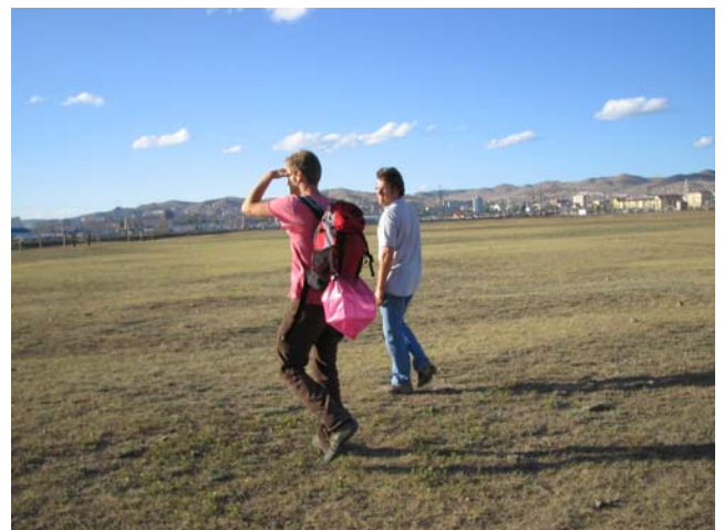
Der Abend naht und wir machen uns auf den Heimweg – voller Energie für die kommende Woche im Krankenhaus!