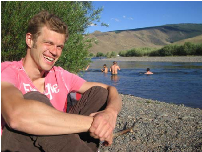
So ein Stückchen Natur tut der Seele gut!